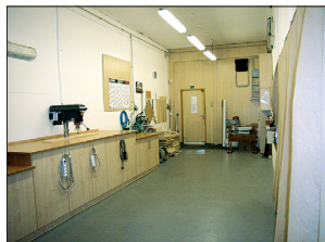
Prostory k podnikání.