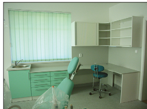
Produkty z výroby klientky.